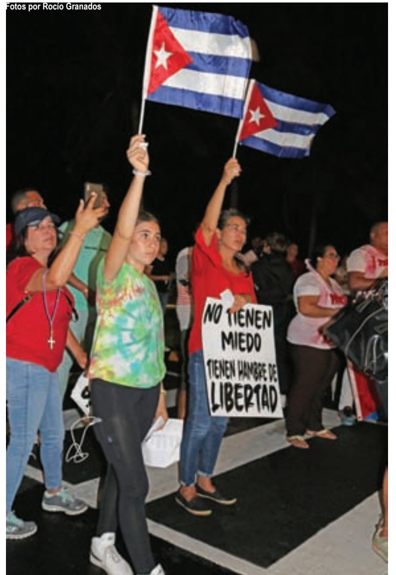
En el evento, donde los cubanos se mantuvieron protestando hasta la noche, se exhibieron todo tipo de lemas alegóricos y banderas cubanas...