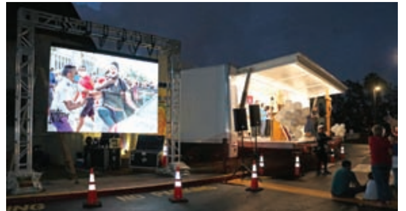
Y no faltaron videos proyectados sobre amplias pantallas, mostrando la brutalidad inhumana de la policía castrista.