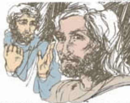
Jesús dirigiéndose a Pedro le dijo: ¿Colócate detrás de mí, satanás!

de Pedro. Para profundizar: Jesús se vuelve y encara también a sus discípulos, que tampoco acaban de comprender lo que ha oído. Jesús les habla radicalmente una vez más. Sus exigencias son firmes, claras y retadoras. Su seguimiento no va precisamente por un camino de rosas, sino de un acatamiento total que lleva a cargar con la cruz que toque llevar.