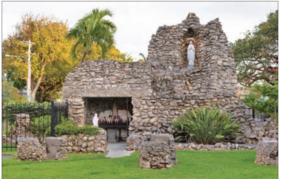
The parish grotto, which depicts the appearance of Our Lady to St. Bernadette in Lourdes, France, was designed by Sister Louis Gabriel and dedicated on May 25, 1922, the feast of the Ascension and the 25th anniversary of her entrance into the Sisters of the Holy Names of Jesus and Mary. The artistic structure is made of coral rock gathered from the school grounds.

"When hurricanes are approaching, the local people show up and start praying," said Florida writer and Key West native Bob Bernreuter, who wrote a book on the his-