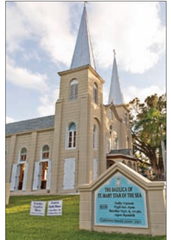
The Basilica of St. Mary Star of the Sea in Key West enjoys a status as a national and state-designated historic site.

tory of the basilica and is an executive officer with Historic Tours of America, a Key West-based national corporation.