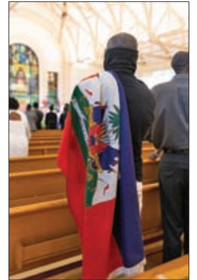
Worshippers pray for Haiti at Notre Dame d'Haiti Catholic Church in Miami during a memorial Mass.