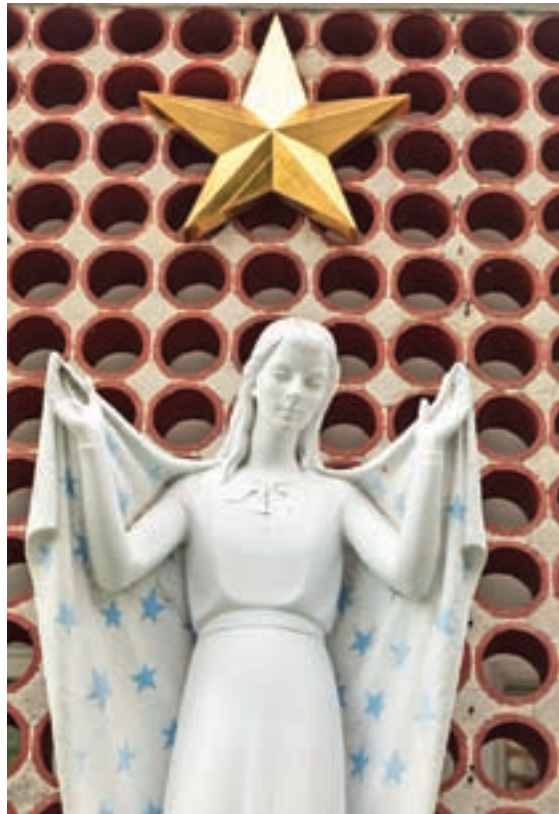
An outdoor statue of Our Lady Star of the Sea is popular with visitors making a pilgrimage to the historic Basilica.