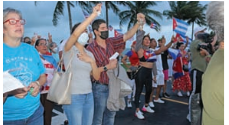
Más de un centenar de cubanos de la diáspora acudieron al santuario de la Ermita de la Caridad, en Miami, el 14 de julio, unos días después de las protestas en la isla, para rezar por los cubanos de allá, ante la represión con la que ha respondido el gobierno cubano.