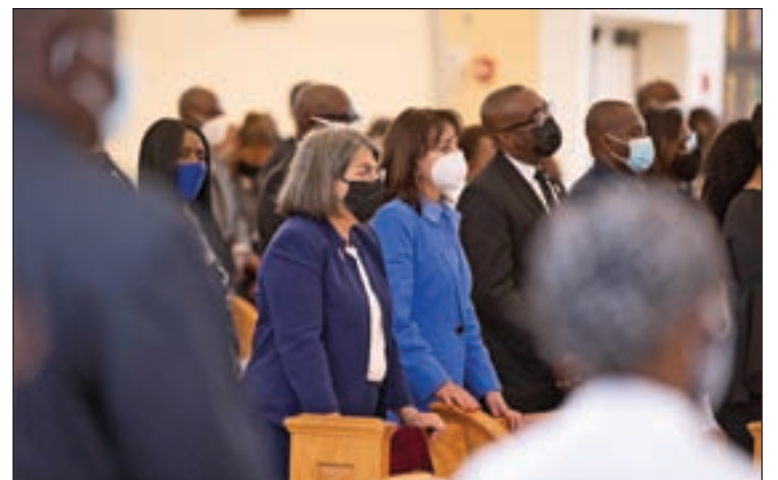
Members of the community, including Miami-Dade County Mayor Daniella Levine Cava, left, pray for Haiti at Notre Dame d'Haiti Catholic Church in Miami during a memorial Mass July 22, 2021 for the late Jovenel Moïse, a day before the former president of Haiti received a state funeral following his assassination July 7. President Moïse was laid to rest July 23 by his wife and three children in their hometown of Cap-Haitien, Haiti.