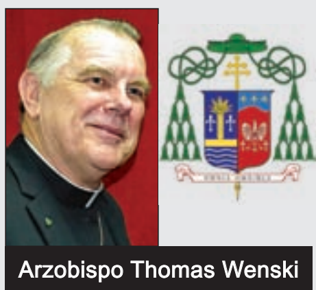
Arzobispo Thomas Wenski

Antes de una reunión de líderes políticos en Glasgow a finales de este año, el Panel Intergubernamental sobre Cambio Climático de la ONU emitió a principios de este mes un informe científico clave sobre el ritmo del calentamiento global. Para aquellos preocupados por el aumento del nivel del mar a lo largo de nuestras costas de La Florida, las noticias no fueron buenas.