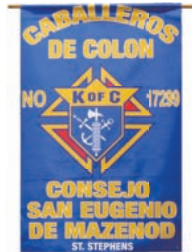
Arriba: Escudo de los Caballeros de Colón del Consejo San Eugenio de Mazenod, de la parroquia St. Stephen, en Miramar, un consejo hispano creado hace aproximadamente tres años.

“Muchos padres no veían que hacer con sus niños en la casa y nos surgió la idea de crear juegos de fútbol y pedirles a los padres que participen directa o indirectamente con sus hijos”, agregó.